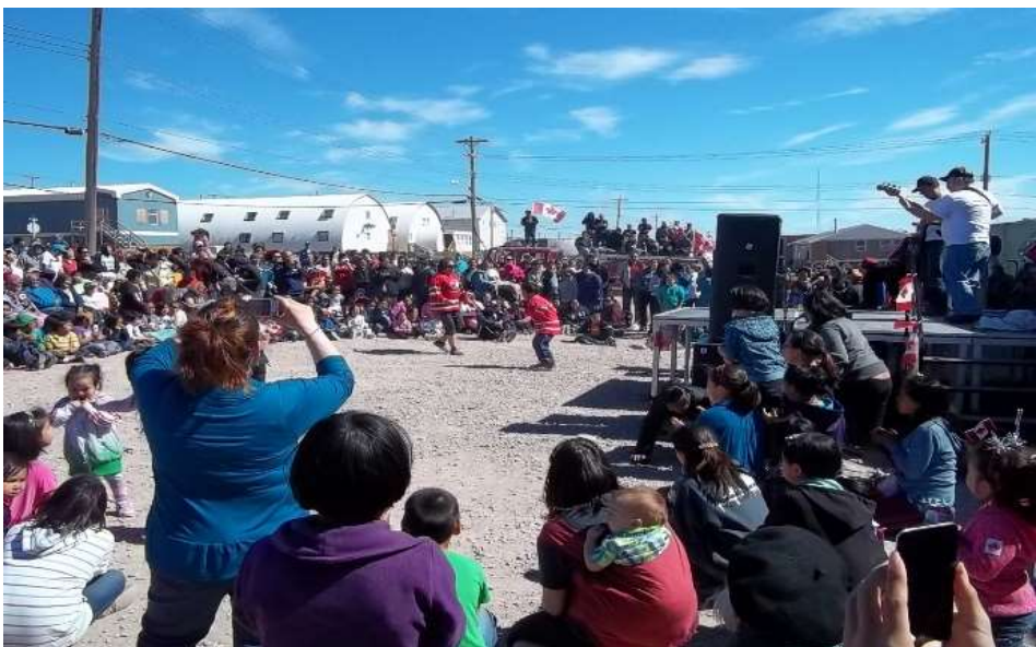
የፍሬግ ክፍለ-መንግሥት ስርዓተ-ግንባታ ስራ ላይ ስራው ለማጠናከር ያስፈልጋል፡-